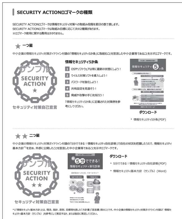
【図1】 SECURITY ACTIONロゴマークの種類※5

今回公表された実態調査報告では、宣言事業者における情報セキュリティ対策の実施状況や課題等を明らかにし、また、本制度に取組むきっかけや効果、本制度および関連施策における課題について取りまとめられています。